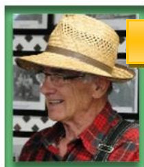
Le Vieux Léon

Samedi 11 juillet à 19 heures Soirée « Contes et musique » suivie d'un « Encan gourmand »